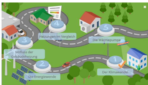
Abb.: Beispiel Hauptmenü in Modul 1 (Kapitel 1 abgeschlossen)

Hiermit öffnen Sie das Hauptmenü . Jedes Lernmodul besitzt ein einprägsam gestaltetes Hauptmenü, über das die einzelnen Kapitel gestartet werden können. Vollständig bearbeitete Kapitel werden durch einen Haken gekennzeichnet.